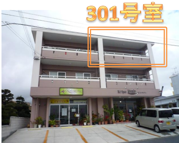
1階ヨガ教室と理髪店